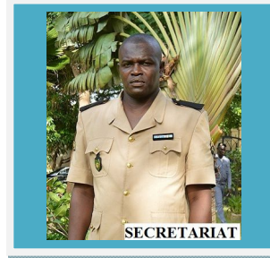
Personnel de la DEMS