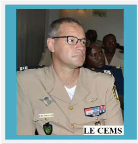
Conseiller Enseignement Militaire Supérieur